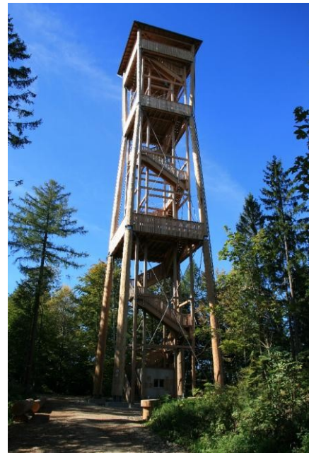
Adrian Böhlen, Chutzenturm, CC BY-SA 3.0

Wem es auf dem Heimreiseweg liegt, kann uns dann noch auf dem Weg nach Moosseedorf zurück begleiten.