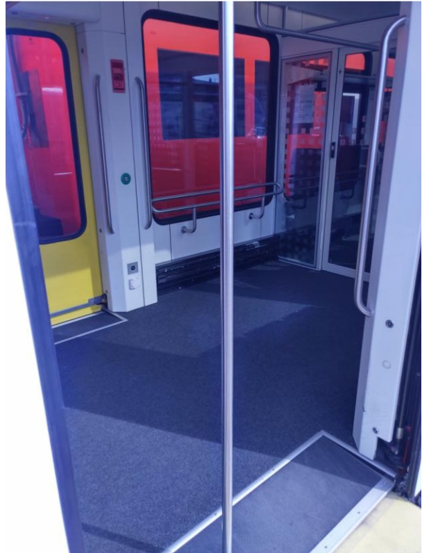
S8 Bern - Moosseedorf - Jegenstorf (Seconda) RE Bern - Jegenstorf - Solothurn (NEXt)