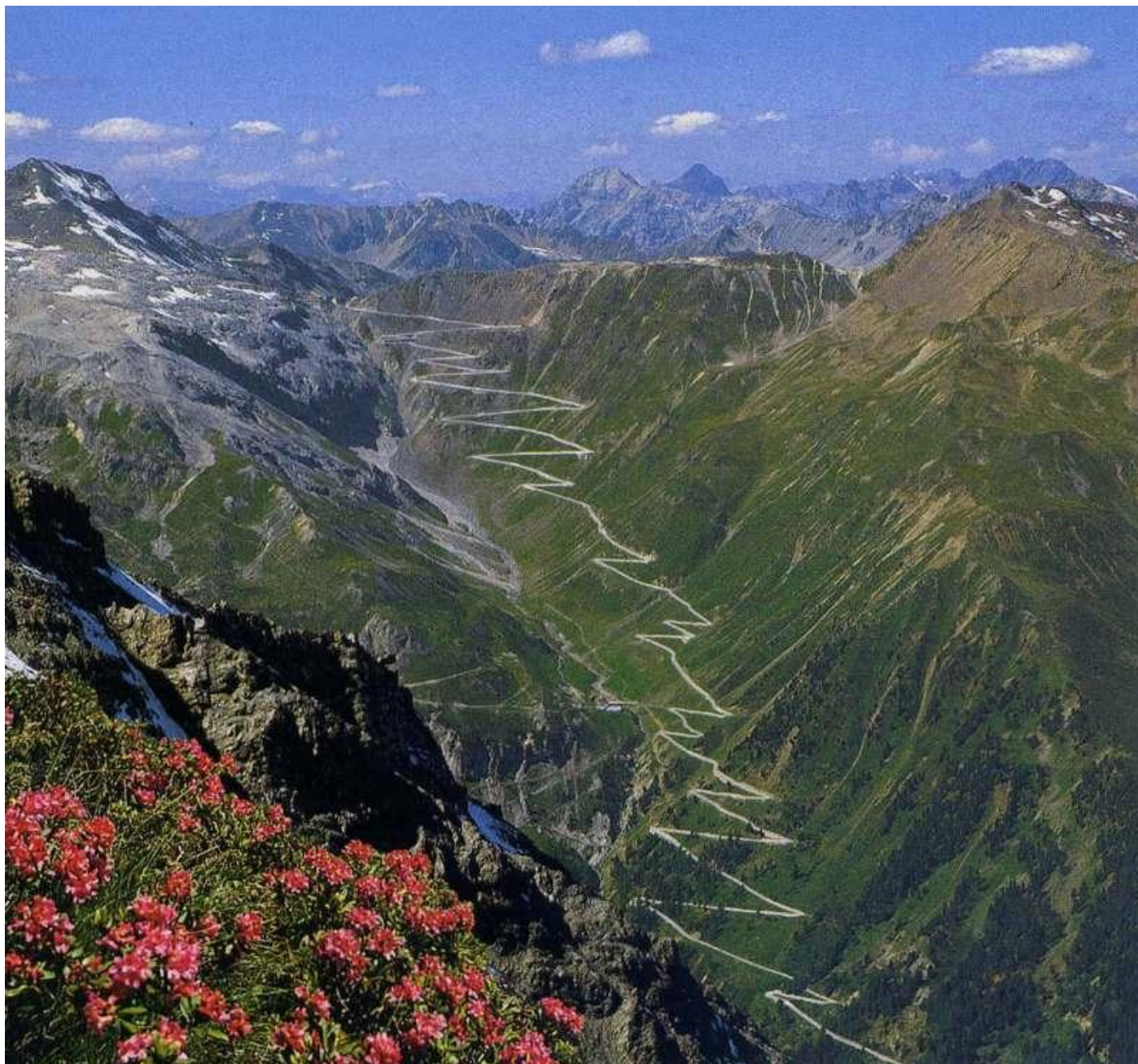
Stelvio, 2757 m