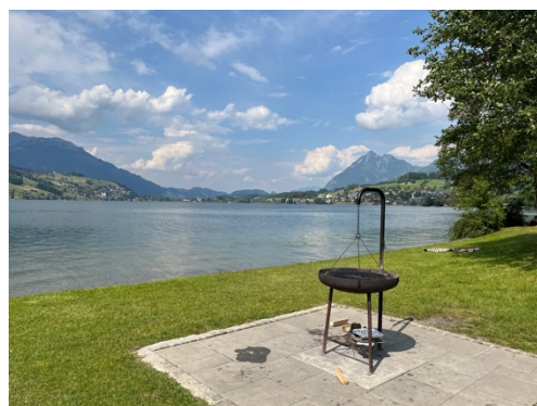
....Bräteln am Sarnersee

Wir freuen uns auf alle, die mitfahren! Liebe Grüsse Andi (079 416 14 62) & Ursi (076 404 42 34)